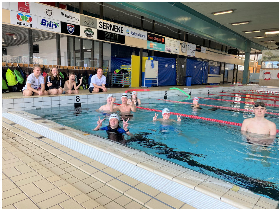
Gruppen Bläckfisken teknik med tränare under fotografering inför Parasportsgalan.

Stort, stort tack till Jerringfonden för detta betydelsefulla pris!